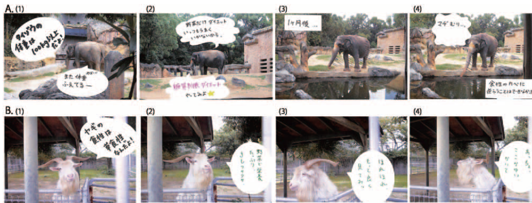
図 2: 1 コマ目の情報が後に続くストーリーに関連がある漫画の例