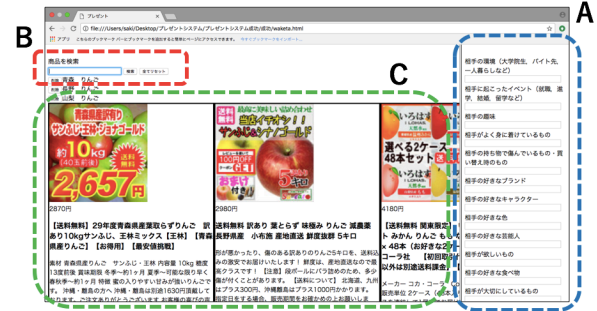
図 1: 提案システム

提案システムは、Web ページで利用することを想定し、HTML, JavaScript で実装した。本稿では、楽天株式会社が展開する楽天ウェブサービスの楽天商品検索 API (version:2017-07-06) を利用した。図 1 に提案システムのインタフェースを示す。質問の回答を記入式にし、システム起動時から常時質問を提示する (図 1-A 参照)。ユーザがプレゼントを選択する中で任意の機会に質問の回答を行う。質問をきっかけに検索キーワードを入力する (図 1-B 参照) ことでそのキーワードに該当する商品が表示される (図 1-C 参照)。質問提示部分を質問欄とする。